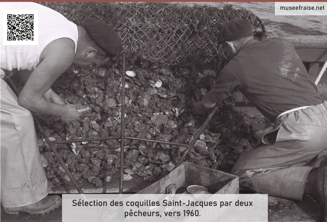
Sélection des coquilles Saint-Jacques par deux pêcheurs, vers 1960.