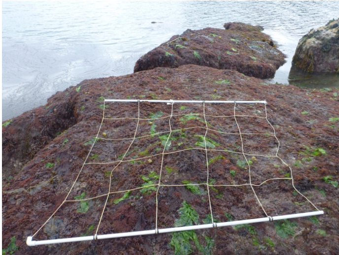
Figure 2 : Le point DCE/REBENT Bifurcaria bifurcata /Algues rouges n° 1 sur le site de Bréhat.